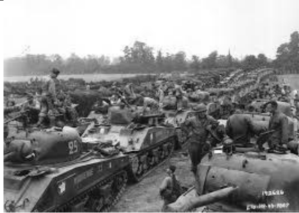
Les blindés de la 2 ème DB avant la bataille de Paris.

Le lendemain, Charles de Gaulle, Churchill et Leclerc défilent sur les Champs -Élysées.