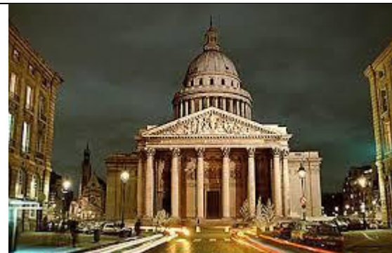
Après la guerre, en 1964, le général de Gaulle fera porter le corps de Jean Moulin au Panthéon, à Paris, là où reposent les « grandes » femmes et « grands » hommes de France.