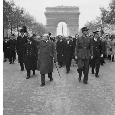
Le général de Gaulle défile sur les Champs Élysées dans Paris libéré. A ses côtés (à gauche), Winston Churchill

Avant la fin de l'année 1 944 toute la France est libérée.