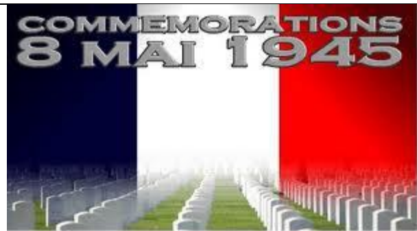
L'armistice du 8 mai 1 945 est célébré tous les ans.