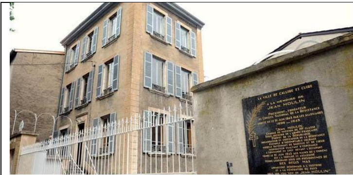
Maison où Jean Moulin fut arrêté par la Gestapo au cours d'une réunion, le 21 juin 1943. Cette maison se situe sur la commune de Caluire, près de Lyon.

Jean Moulin est un héros de la Résistance.