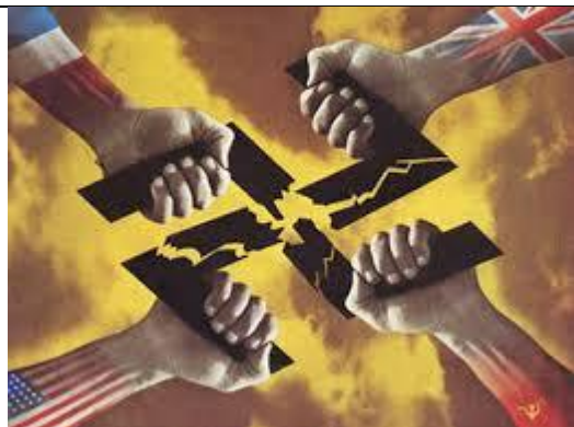
Comment comprends-tu cette affiche ?