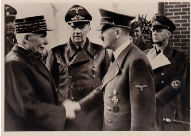
Pétain (à gauche), Hitler à droite.

Juin 1 940, l'armée française est battue. Le maréchal Pétain, chef du gouvernement se rend. Hitler et Pétain signe un armistice à Rethondes (là où fut signé l'armistice du 11 novembre 1 918).